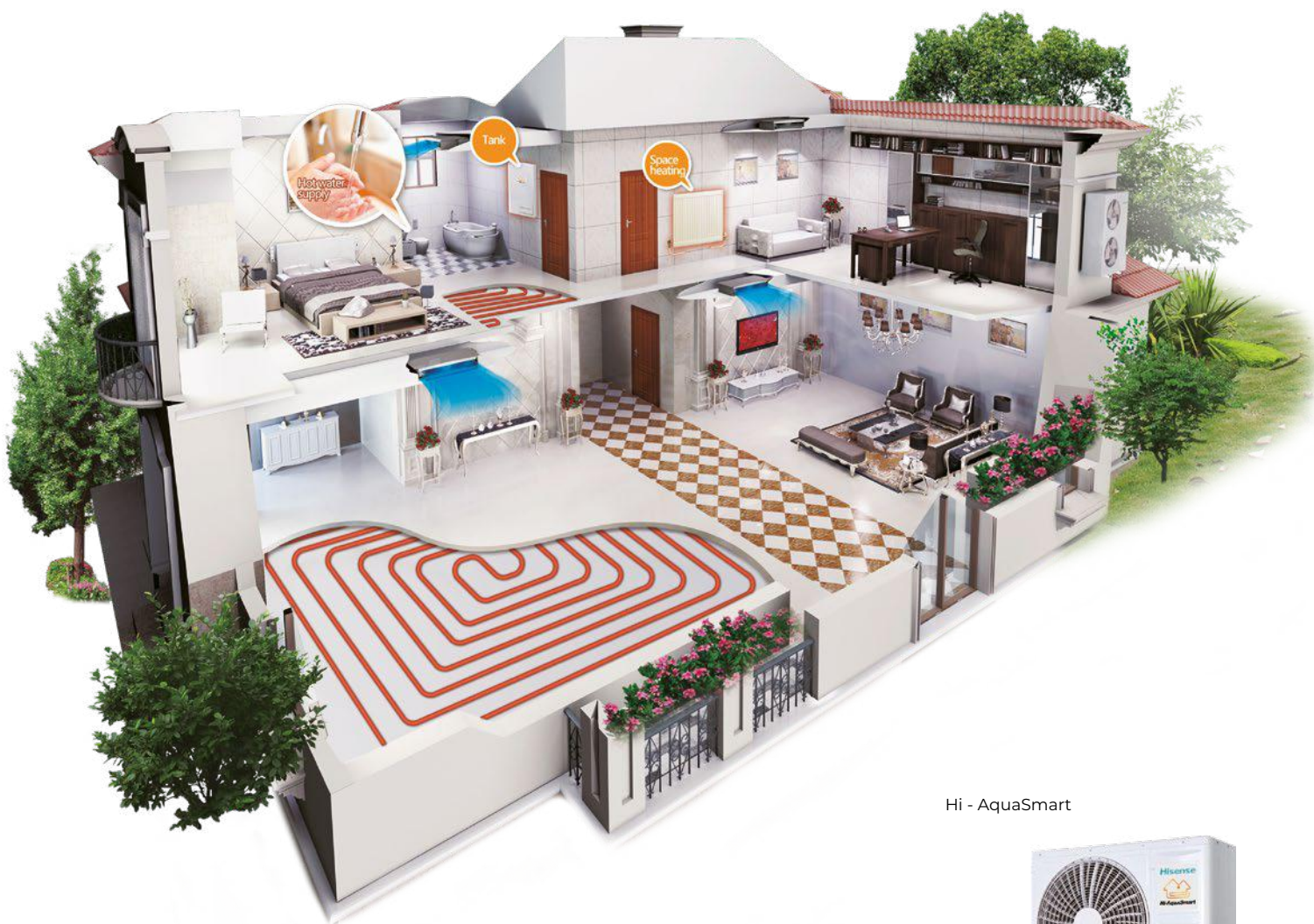
Hi - AquaSmart

El sistema de bomba de calor aerotermia de Hisense absorbe la energía gratis del ambiente exterior, consumiendo así menos electricidad para generar más energía térmica. La serie Hi-AquaSmart tiene un mejor rendimiento, alta eficiencia, un elevado ahorro de energía y produce menos emisiones de CO 2 . Esta serie puede ser fácil de instalar en edificios nuevos o existentes. Las bombas de calor aerotermia de Hisense de alta eficiencia obviamente pueden reducir el consumo de energía del edificio. Y además, pueden funcionar con una fuente de calefacción tradicional, como una caldera de gas o gasoil.