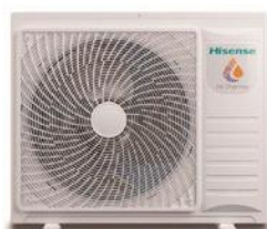
Bi Bloc 4,4/6/8 kW