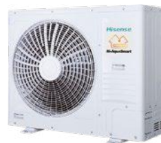
Bi Bloc 12 kW