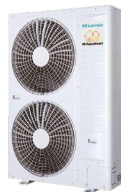
Bi Bloc 14/16 kW