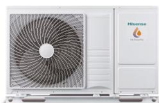
Monobloc 4,4/8 kW